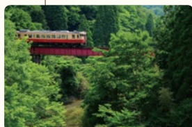
小湊鐵道随一の高さを誇る橋梁はスリリング!?