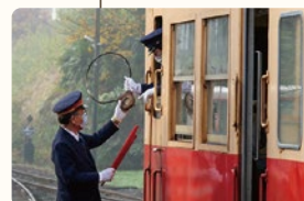
里見駅では、貴重なタブレット交換が行われます。