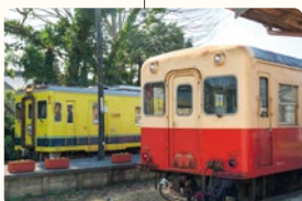
上総中野駅ではすみ鉄道の車両と出会えます。