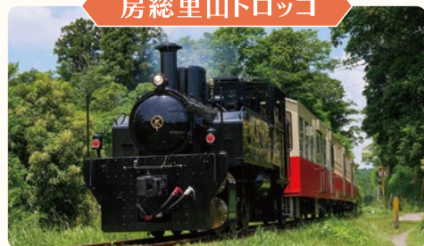
房総里山トロッコ

2021年より導入された小湊鐵道の新たな仲間。クロスシートの車内は旅情もたっぷり。どのカラーになるかは来てのお楽しみ。