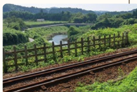
蛇行する養老川をバイパスした川廻しが見られます。