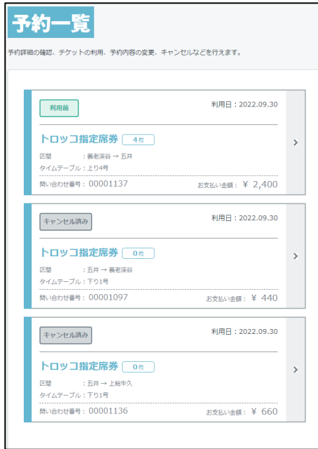
【マイページから予約一覧へ】